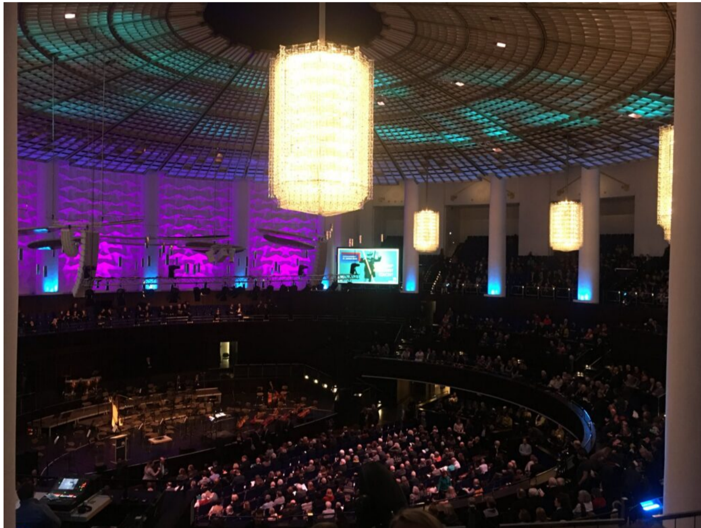
“Az éjszaka” Holokauszt Oratórium a hannoveri Kuppelsaalban. 2020. január 27

Az Európai Kántorszövetség konferenciát tartott Hannoverben, a Holokauszt Emléknapja alkalmából.